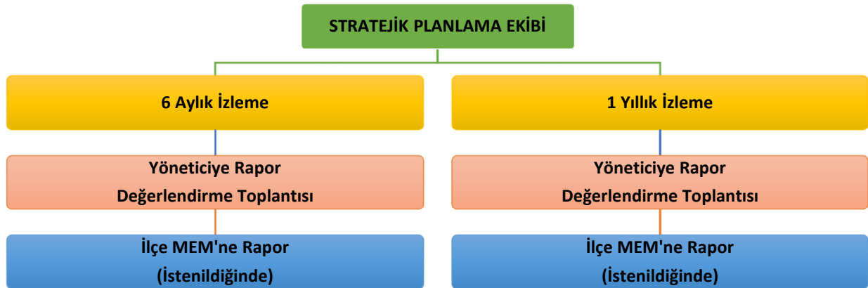
Şekil 3. İzleme ve Değerlendirme Süreci

Müdürlüğümüzün 2024-2028 Stratejik Planı İzleme ve Değerlendirme sürecini ifade eden İzleme ve Değerlendirme Modeli hazırlanmıştır. Müdürlüğümüzün Stratejik Plan İzleme-Değerlendirme çalışmaları eğitim-öğretim yılı çalışma takvimi de dikkate alınarak 6 aylık ve 1 yıllık sürelerde gerçekleştirilecektir. 6 aylık sürelerde Müdürlüğümüze rapor hazırlanacak ve değerlendirme toplantısı düzenlenecektir. 6 aylık ve yıllık izlemelerle ilgili değerlendirme toplantıları düzenlenecektir.